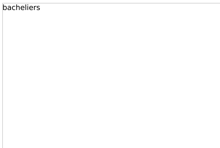
Fête des bacheliers créée en 2021

6 500 élèves dans 29 écoles, 3 800 à la cantine et 2 500 en centre de loisirs